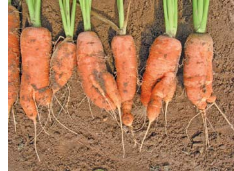
Beinigkeit und Wurzelgallen an Möhren nach Befall mit Wurzelgallennematoden

Durch die Schädigung der Wurzel werden Wasser- und Nährstoffaufnahme gestört und die Pflanze reagiert mit Welke bzw. physiologischen Störungen. Durch den Nährstoffentzug wird die Pflanze geschwächt und dadurch anfälliger für andere Schadorganismen bzw. ungünstige Umweltbedingungen. Insgesamt ist das Wachstum stark beeinträchtigt. Oberirdisch weisen ein unregelmäßiger Pflanzenbestand oder nesterartige Fehlstellen auf einen Nematodenbefall hin. Unterirdisch treten je nach Nematodenart Symptome auf wie Beinigkeit, Fäule, Deformationen, Gallen, extreme Seitenwurzelbildung, verkürzte Wurzeln oder Nekrosen.