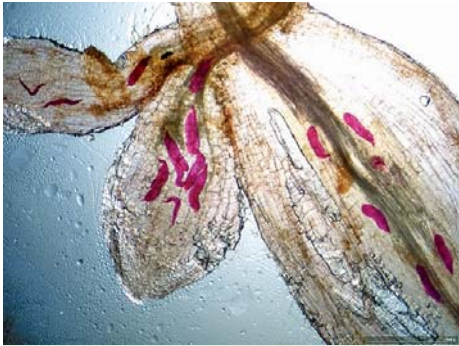
Wurzelgallennematoden ( Meloidogyne incognita ) in Tomatenwurzeln

Die meisten Nematoden ernähren sich von Bakterien oder Pilzhyphen und sind unverzichtbarer Bestandteil des Bodenökosystems. Einige saugen aber auch an Wurzeln und können so erhebliche Schäden an unseren Kulturpflanzen verursachen. Andere wiederum treten als Tier- oder Humanparasiten auf oder werden, wie im Falle von Steinernema und Heterorhabditis , sehr erfolgreich zur biologischen Bekämpfung von Insekten eingesetzt.