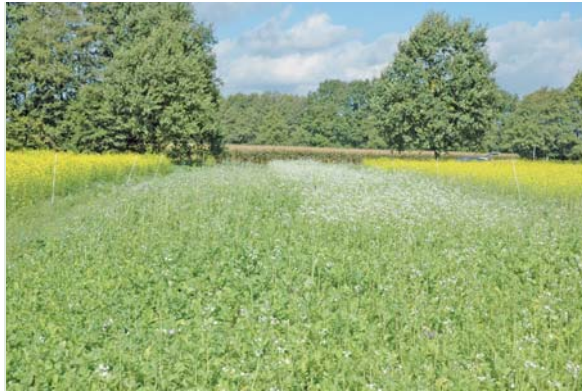
Anbau von Zwischenfrüchten (z. B. Ölrettich, Weißer Senf, Rauhafer) fördert das Bodenleben und reduziert bestimmte Nematodenarten