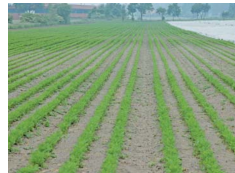
Nesterartiger Minderwuchs an Möhren durch Pratylenchus penetrans

Um einen Befall frühzeitig zu erkennen, ist eine regelmäßige Kontrolle erforderlich. Besteht der Verdacht eines Nematodenbefalls, empfiehlt es sich, aus den verdächtigen Stellen (z. B. Minderwuchs, Vergilbungen) im Feld einige Pflanzen vorsichtig auszugraben. Die Symptome an der Wurzel lassen oftmals die Ursache gut erkennen. Gegebenenfalls sollten Pflanzen- und/oder Bodenproben entnommen und von einem Fachlabor auf Nematodenbefall untersucht werden.