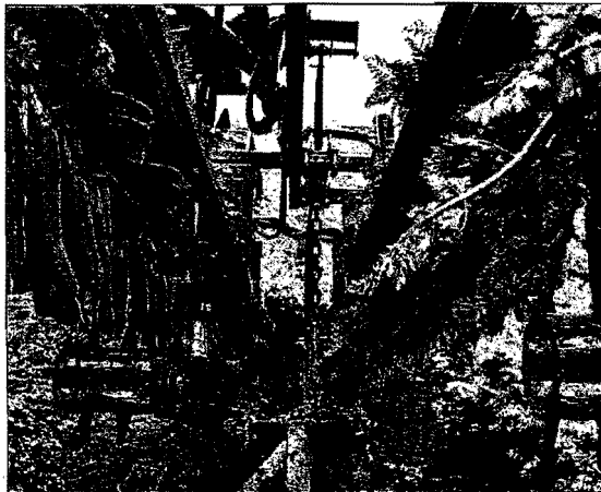
Verwerkers stellen hoge eisen aan kwaliteit van groente.

Volgens Molendijk wordt eerst geïnventariseerd welke systemen worden gebruikt in Duitsland en Nederland voor de bemonstering op aaltjes. "We zoeken de meest geschikte eruit, zodat je voor zo